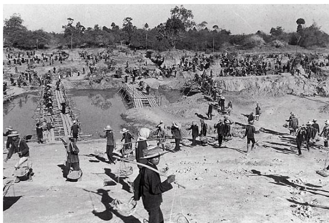
Rys. 3. Mieszkańcy Demokratycznej Kampuczy podczas wykonywania robót

w pełni sił dzielono jeszcze na dwie podkategorie – pierwsza składała się z młodych, dobrze zbudowanych samotnych osób, które tworzyły tzw. ruchome zespoły robocze. Należały do nich grupy dzieci między siódmym a czternastym rokiem życia oraz dorośli stanu wolnego, pracujący z dala od rodzin i macierzystych wiosek w zespołach składających się wyłącznie z osób tej samej płci. Grupy te zajmowały się budową kanałów irygacyjnych, zbiorników retencyjnych, oczyszczaniem i kultywacją gruntów. Druga podkategoria osób w pełni sił to zamężne kobiety i żonaci mężczyźni, którzy pracowali w oddzielnych zespołach, ale względnie blisko wioski. Umożliwiało to sporadyczne kontakty rodzinne. Osoby z tej grupy pracowały na polach ryżowych, wyrębie lasów, naprawie dróg i szlaków kolejowych. Kategoria osób nie w pełni sił to starcy oraz młodsze dzieci, przeznaczone do wykonywania drobnych prac, np. przy dojeniu krów, nawożeniu pól i pieleniu chwastów 14 .