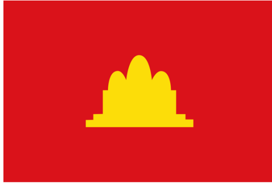
Rys. 2. Flaga Czerwonych Khmerów