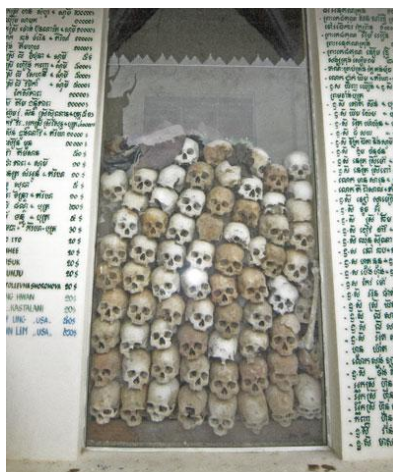
Rys. 4. Phnom Penh – Muzeum Ludobójstwa Tuol Sleng – Byle Więzienie Bezpieczeństwa 21

Szacuje się, że liczba mieszkańców stolicy – Phnom Penh – wskutek przymusowych wysiedleń zmalała z 2 milionów do 23 tysięcy mieszkańców w ciągu pierwszego tygodnia rządów Khmerów. Rozmiary przemocy w Demokratycznej Kampuczy były przerażające, ale dla większości mieszkańców Kambodży nie tak straszny był widok śmierci, jak nieprzewidywalność oraz atmosfera tajemniczości, w jakiej bez przerwy znikali ludzie. Skalę destrukcji społecznej podkreśla to, że około 64 procent młodzieży w latach dziewięćdziesiątych było sierotami 18 .