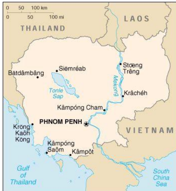
Rys. 5. Mapa Kambodży